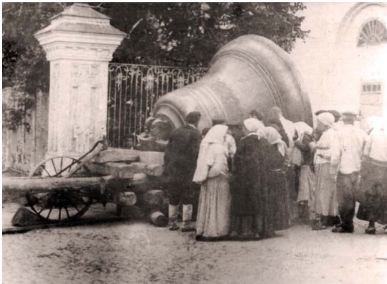
Старый колокол, сброшенный в тридцатые годы прошлого столетия с колокольни Спасского кафедрального собора

В СТАРИНУ В ПЕНЗЕНСКОЙ ГУБЕРНИИ, КАК И ПО ВСЕЙ РОССИИ, ЭПИДЕМИИ ЛЕЧИЛИ КОЛОКОЛЬНЫМ ЗВОНОМ