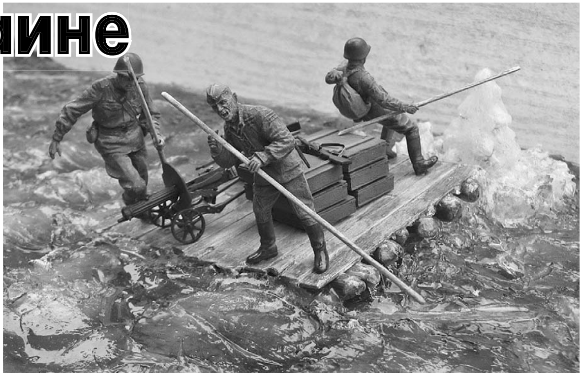
Фрагмент диорамы «Битва за Днепр» в Центральном музее Великой Отечественной войны

Чтобы выявить огневые точки противника, его скрытые резервы, командир полка прика-