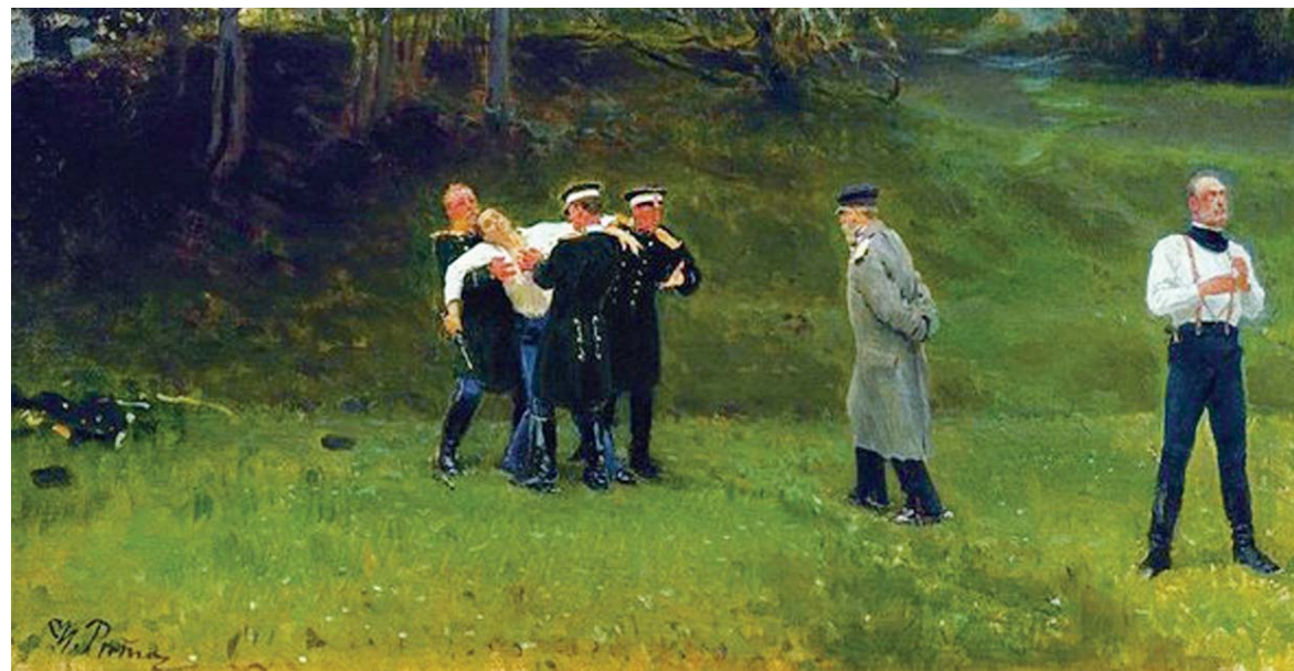
И.И. Репин. Дуэль

В материале приведены строки из поэмы М.Ю. Лермонтова «Тамбовская казначейша».